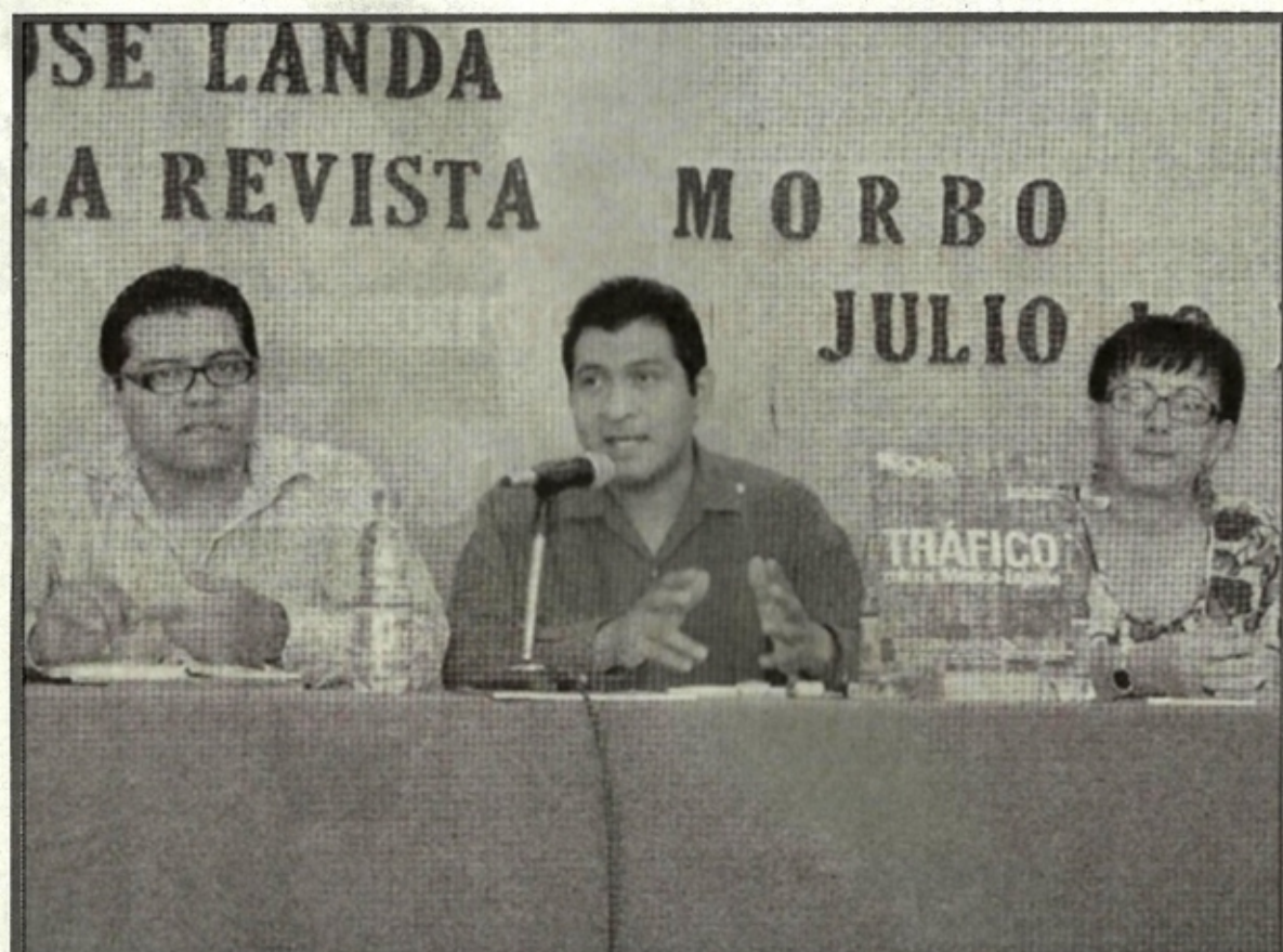
"Morbo", publicación trimestral de sociedad, arte y culturas híbridas, tiene como objetivo provocar a los lectores. ♦ Fabián Rivera. CP

Todos aquellos interesados en torno a este interesante pro- yecto editorial pueden contac- tar a los editores a través de edicionesmorbo@gmail.com y www.edicionesmorbo.com. ♦